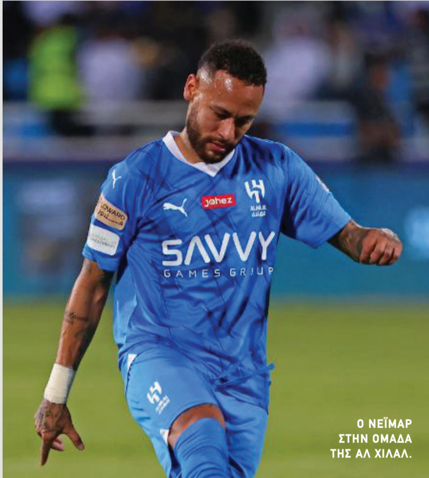
Ο ΝΕΪΜΑΡ ΣΤΗΝ ΟΜΑΔΑ ΤΗΣ ΑΛ ΧΙΛΑΛ.