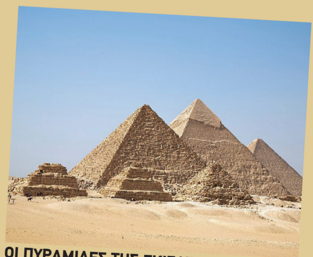
ΟΙ ΠΥΡΑΜΙΔΕΣ ΤΗΣ ΓΚΙΖΑΣ.

Η ΑΙΓΥΠΤΟΣ είναι ένα κράτος που βρίσκεται στη βορειοανατολική Αφρική θεωρείται μια μεγάλη δύναμη στη Βόρεια Αφρική και είναι γνωστή για τις αιγυπτιακές πυραμίδες. Οι πυραμίδες έχουν βρεθεί στη Σακάρα βορειοδυτικά της Μέμφιδος, οι πιο γνωστές όμως πυραμίδες είναι αυτές της Γκίζας στα προάστια του Καΐρου. Το 1842 ο Καρλ Ρίχαρντ Λέψιους έφτιαξε τον πρώτο σύγχρονο κατάλογο πυραμίδων. Εμένα η καταγωγή μου είναι από την Αίγυπτο και έχω πάει πολλές φορές με την οικογένεια μου. Είναι μια όμορφη χώρα. Έχει ωραία φαγητά και πολύ ωραία μέρη για να πας βόλτες. Αξίζει να την επισκεφτείτε κάποια στιγμή.