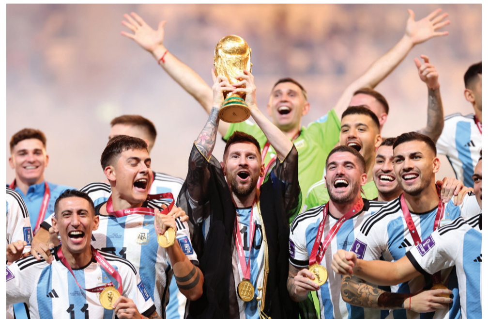
Ο ΛΙΟΝΕΛ ΜΕΣΙ «ΣΗΚΩΝΕΙ» ΤΟ ΚΥΠΕΛΟ WORLD CUP

Ηθέλε πάρει πολύ να κερδίσει η ομάδα του και να σκώσει και αυτό το κύπελο όπως και έγινε στις 18/12/2022 ο Λιονέλ Μέσι σκόωσε στα χέρια του και το κύπελο World cup και η ομάδα της Αργεντινής ήταν η νικήτρια του World cup 2022.