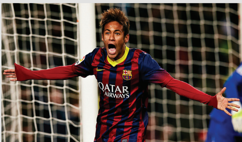
ΠΑΝΥΓΥΡΙΖΕΙ ΤΟ ΓΚΟΛ ΠΟΥ ΕΒΑΛΕ ΣΤΗΝ ΟΜΑΔΑ ΤΗΣ ΜΠΑΡΤΣΕΛΟΝΑ.

Εσένα ποιος είναι ο αγαπημένος σου ποδοσφαιριστής στείλε μας στο email sg104dimotiko@gmail.com